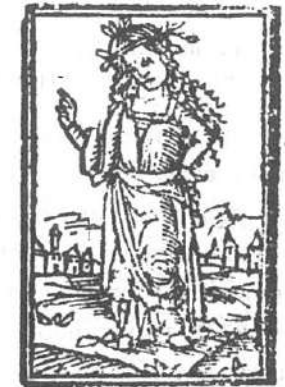
Breviarium Majoricensis (1506)

L'objectiu d'aquesta comunicació és analitzar el concepte de música emblemàtica a partir de l'exemple del cant de la sibil·la mallorquina. Analitzarem de quina manera aquesta música pot esdevenir emblemàtica i en quines situacions podem parlar de la sibil·la com a paradigma de música emblemàtica. Una vegada establert el marc teòric, a partir de les aportacions de J. Martí (2000) sobre els conceptes deduïbles de la relació entre la música i l'emblema, plantegem l'estudi de cas. A partir de l'observació i l'anàlisi de dues situacions veurem com el cant de la sibil·la és instrumentalitzat per esdevenir emblema de mallorquinitat.